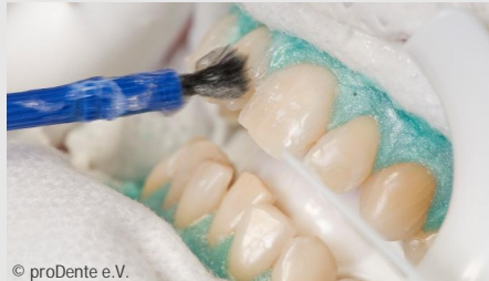
Power-Bleaching beim Zahnarzt: Auftragen des Bleaching-Gels

Wenn Sie die Praxis wieder verlassen, können Sie sich an sichtbar helleren Zähnen freuen!