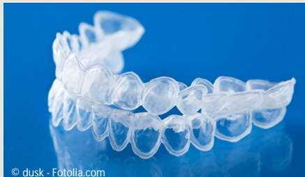
Bleaching-Form aus Kunststoff, in die Sie das Aufhellungs-Gel einfüllen.

Beim Home-Bleaching werden vom Zahnarzt dünne flexible Formen aus einem transparenten Kunststoff hergestellt, die genau auf Ihre Zähne passen (siehe Foto).