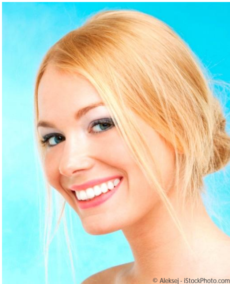
Bleaching vom Zahnarzt: Gewinnendes Lächeln mit strahlend weißen Zähnen

Professionelle Zahnaufhellung durch den Zahnarzt